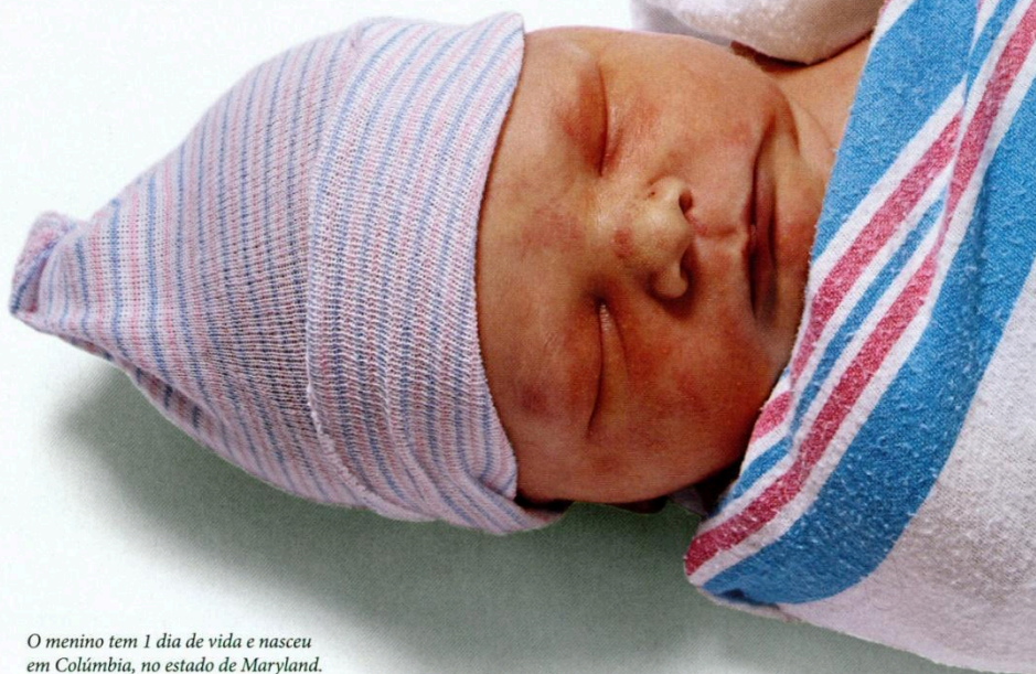
O menino tem 1 dia de vida e nasceu em Colúmbia, no estado de Maryland. Os bebês americanos têm hoje mais de 50% de chance de alcançar os 100 anos.

Em todo o mundo, houve melhora geral na saúde das crianças – por essa razão, as disparidades globais só persistem devido a ganhos na saúde dos idosos nos países desenvolvidos. E qual é a melhor maneira de fazer parte desse clube dos centenários? Não há resposta única. Mas a maioria dos estudos revela que, se você é mulher, não fuma, não tem preocupações financeiras nem está acima do peso, então tem grandes possibilidades de chegar lá. – Por Brad Scriber