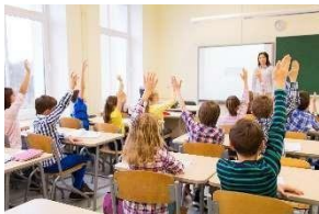
S na sala de aula