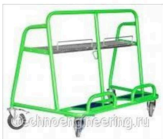
Тележка для перевозки листов ГКЛ