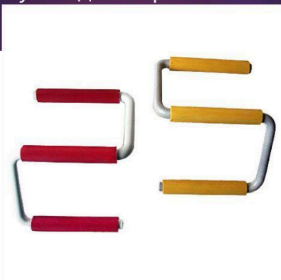
Ручки для переноски ГКЛ