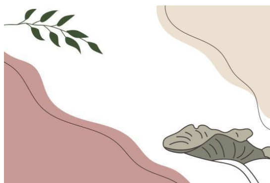
Gambar 1. Nama gambar (garamond, 11pt)

(garamond, 11pt)