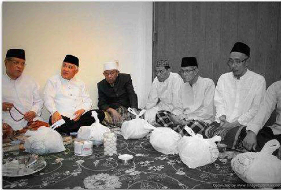
Suasana Pembacaan Tahlil Secara Bersama – sama.