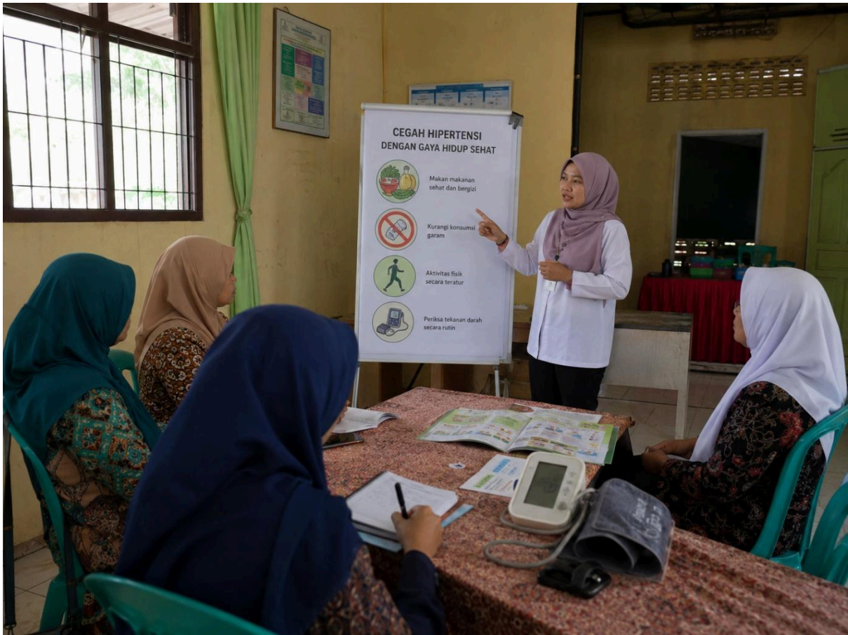
Gambar 1. Pelaksanaan Edukasi Kesehatan tentang Pencegahan Hipertensi kepada Kader Kesehatan