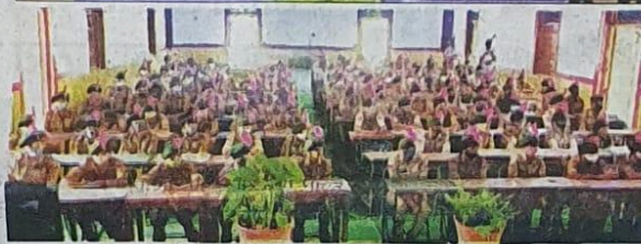
ब्यावर। शिविर शुभारंभ पर मौजूद अतिथि तथा एनसीसी कैडेट्स।