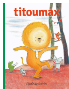
Titoumax De 2 à 4 ans