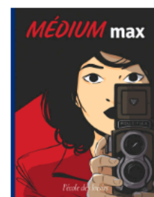
MÉDIUM max Pour les ados