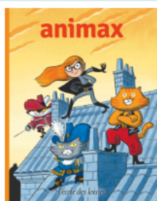
Animax De 7 à 9 ans