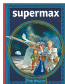
Supermax De 11 à 13 ans