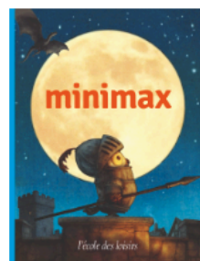
Minimax De 3 à 5 ans