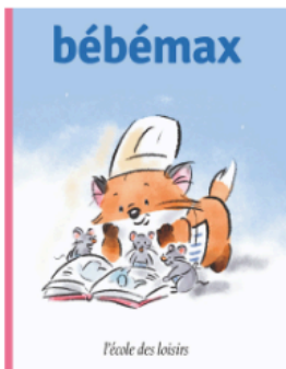
Bébémax Jusqu'à 3 ans