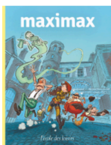
Maximax De 9 à 11 ans