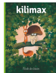
Kilimax De 5 à 7 ans