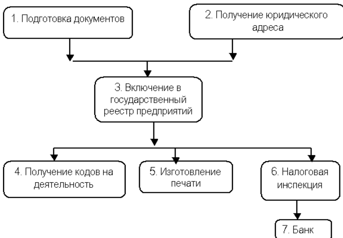
Рис. 2 Порядок организации предприятия