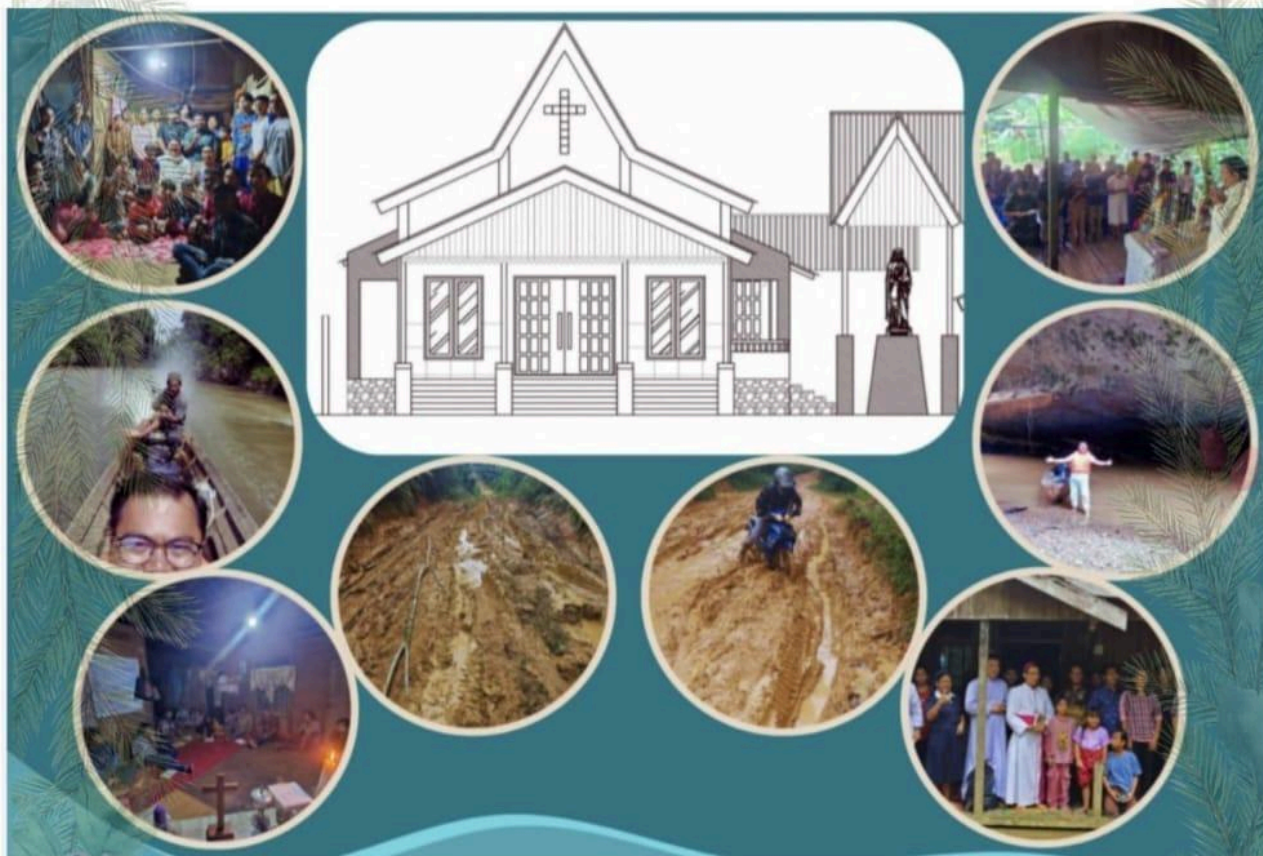
Transportasi Bahan Material (Jalur Sungai):

Mari membantu saudara-saudara kita, dalam karya pembangunan Gereja Katolik St. Maria Mater Dei di Dusun Dayak Lawangan, Keuskupan Banjarmasin. Mereka sangat membutuhkan bantuan para donatur untuk membantu pembangunan Gereja yang layak dipakai guna pengembangan iman dan komunitas umat di Stasi Misim ini. TUHAN MEMBERKATI