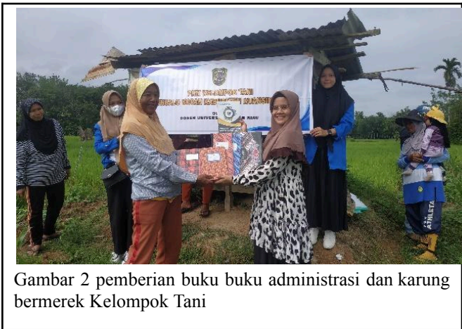
Gambar 2 pemberian buku administrasi dan karung bermerek Kelompok Tani

Daftar pustaka ditulis berdasarkan style American Psychological Association 6 th . Wajib menggunakan Reference manager (Mendeley, zetero dll) agar penulisannya konsisten dan memudahkan dalam editing dan review. Sumber-sumber yang dirujuk dan minimal 20 referensi (17 dari artikel jurnal) dan 90% berupa pustaka terbitan 10 tahun terakhir (2013 – 2023). [ Times New Roman , 11, normal].