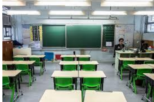
Gambar 1. Pelaksanaan Penelitian (ukuran keterangan gambar Arial 9pt)

Jurnal versi cetak dicetak dengan warna hitam putih, penulis sebaiknya menyesuaikan gambar dengan kondisi tersebut. Contoh peletakan serta penamaan gambar seperti pada Gambar 1 dan contoh menampilkan diagram pada Gambar 2