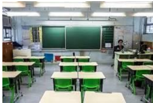
Gambar 1. Pelaksanaan Penelitian (ukuran keterangan gambar Arial 9pt)

Jurnal versi cetak dicetak dengan warna hitam putih, penulis sebaiknya menyesuaikan gambar dengan kondisi tersebut. Contoh peletakan serta penamaan gambar seperti pada Gambar 1 dan contoh menampilkan diagram pada Gambar 2