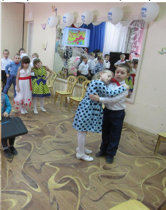
Праздник 8 Марта (танец Весна)

Образовательная область «Познавательное развитие»