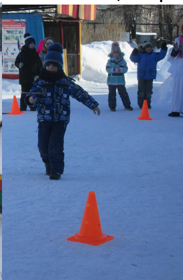
Прогулка на свежем воздухе