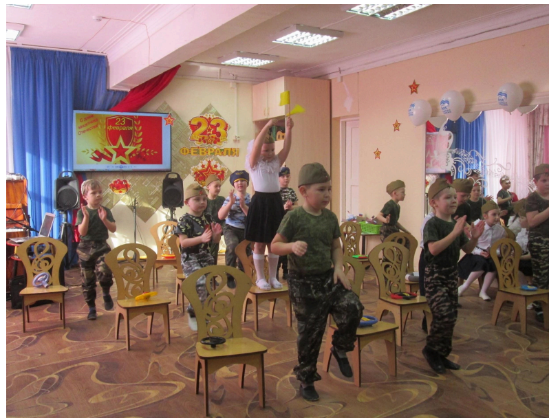
Праздник День Защитника Отечества (Танец Шофёр)