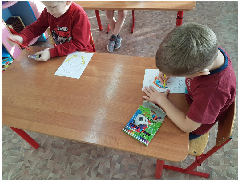
Рисование «Портрет мамы»