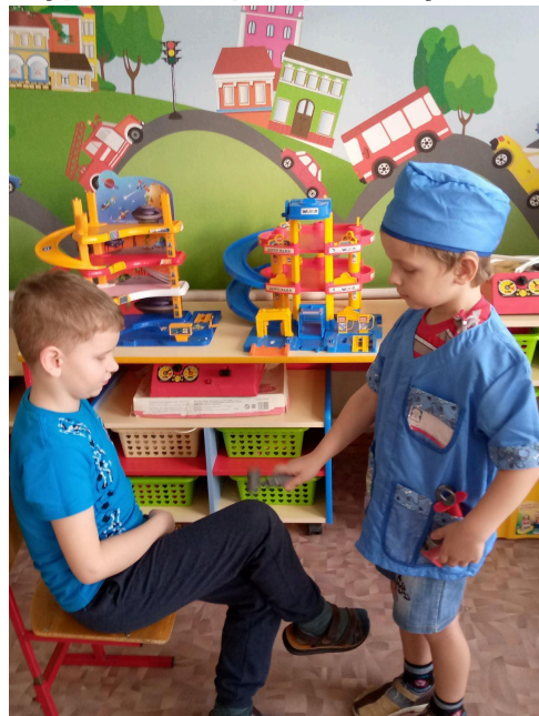
Сюжетно-ролевая игра «Профессии»