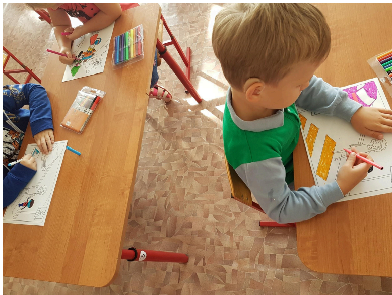
Рисование «Правила дорожного движения»