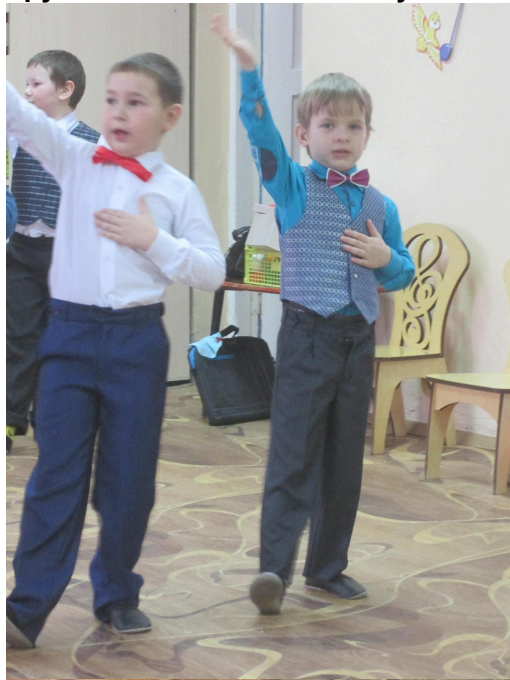
Праздник «Новый Год»