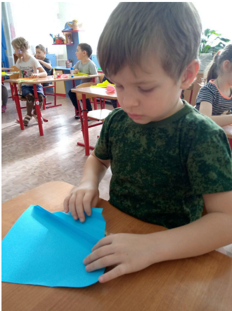
Конструирование из бумаги «Кораблик»

Образовательная область «Социально-коммуникативное развитие»