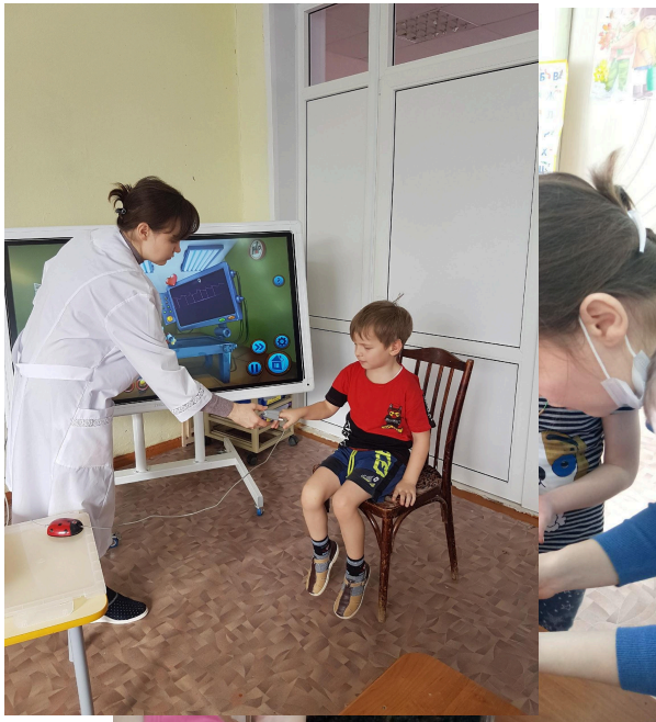
Наураша Лаборатория «Звук»