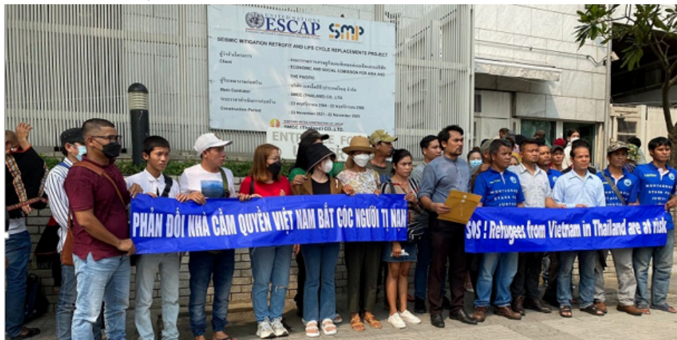
Người Việt Nam tị nạn biểu tình trước Văn phòng UNHCR ngày 19/4/2023.