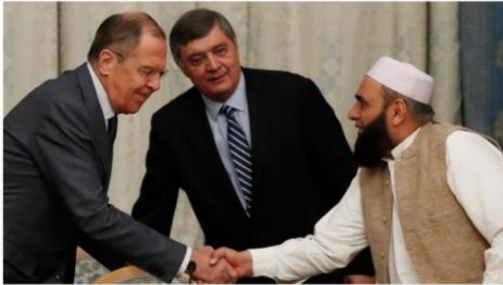
Russian foreign minister Sergei Lavrov (L) shakes hands with Taliban counterpart. [ArianaNews, Twitter]

Trong mấy tuần qua, những người không biết nhiều về chính trị Afghanistan sẽ khinh bỉ cựu tổng thống của quốc gia này hết sức chỉ vì bản tin của một hãng tin Nga: “Tổng thống Afghanistan bỏ trốn với nhiều xe và trực thăng chứa đầy tiền bạc” (Afghan president fled with cars and helicopter full of cash – RIA”.