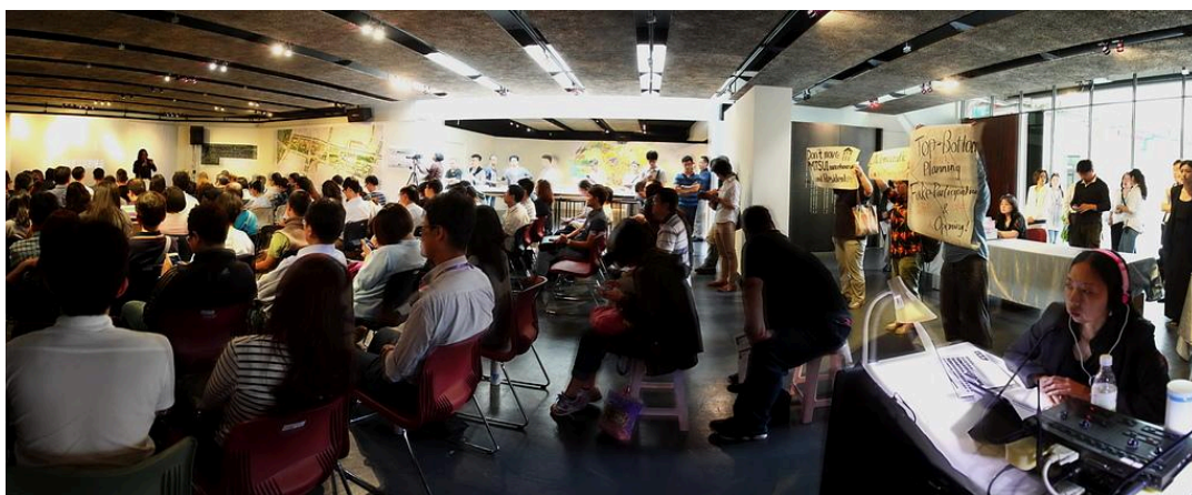
（研討會現場）

因此，我們決定到場外開記者會發表我們的意見，但沒想到，到現場才發現竟然可以自由入場？！於是在林洲民局長以英文發表他的台北高見後，我們也舉海報爭取發言，希望讓外賓理解，不只是西區門戶計畫，而是台北市政府的各大區域計畫都充滿著爭議，無奈我們這一段發言並沒有被口譯成英文。