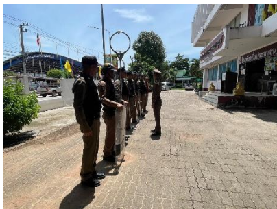
ภาพประกอบ ผลการดำเนินงาน