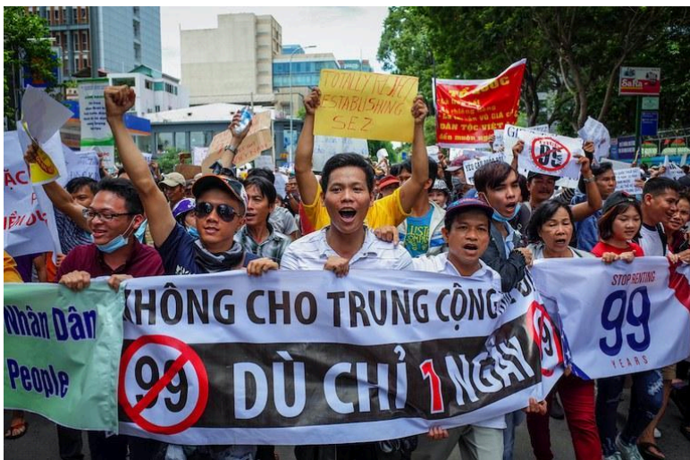
Biểu tình phản đối Dự luật Đặc Khu ở TPHCM hôm 10/6/2018.

Nhận định từ 1989 của Fransis Fukuyama về nền dân chủ tự do của phương Tây có thể là giai đoạn cuối cùng của quá trình tiến hóa văn hóa xã hội của nhân loại chưa thể đến khi xuất hiện phiên bản đảng cộng sản toàn trị kiểu như Trung Quốc, Việt Nam... hiện nay. Giới lãnh đạo của biến thể này coi sự sụp đổ của Liên Xô là bài học, Mikhail Gorbachov là tội đồ khi coi công khai (гласность) là mục đích cải tổ (перестройка). Phiên bản này tồn tại với 'chính sách thực dụng', mở cửa hội nhập kinh tế thị trường và cải cách để thích nghi, và trong suốt hơn một phần ba thế kỷ được coi là thành công kinh tế, nhưng chuyển đổi dân chủ theo mô hình của phương Tây đã không thể diễn ra. Tính chính danh của đảng độc quyền được duy trì bởi tăng trưởng kinh tế. Mô hình Trung Quốc từng có ảnh hưởng đáng kể đến các nước đang phát triển. Khác với mô hình dân chủ phương Tây, đặc trưng của mô hình Trung Quốc luôn phải theo đuổi quyền lực để duy trì chế độ, thanh trừng phe phái luôn xảy ra và tự do cá nhân bị cấm đoán.