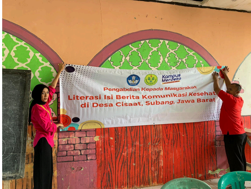
Gambar 1.2 Pemasangan Banner Kegiatan

Salah satu mahasiswa dalam tim penelitian dibantu oleh staff Universitas Negeri Jakarta melakukan persiapan acara dengan memasang banner kegiatan di tempat kegiatan sosialisasi akan dilaksanakan.