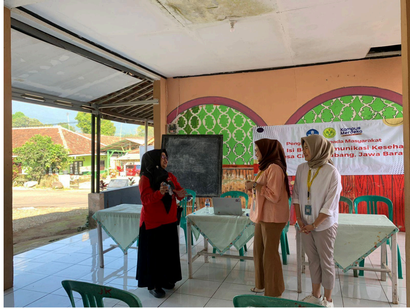
Gambar 1.6 Sesi Tanya Jawab dengan Warga Desa Cisaat

Salah satu warga Desa Cisaat mengajukan pertanyaan kepada mahasiswa yang memberikan materi tentang praktik pengolahan sampah organik dan non-organik guna mencegah penyebaran nyamuk penyebab demam berdarah.