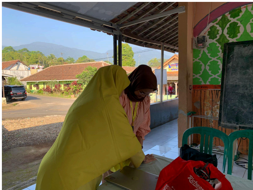
Gambar 1.3 Pelaksanaan Briefing

Salah satu mahasiswa dalam tim penelitian dibantu oleh staff Universitas Negeri Jakarta melakukan persiapan acara dengan memasang banner kegiatan di tempat kegiatan sosialisasi akan dilaksanakan.