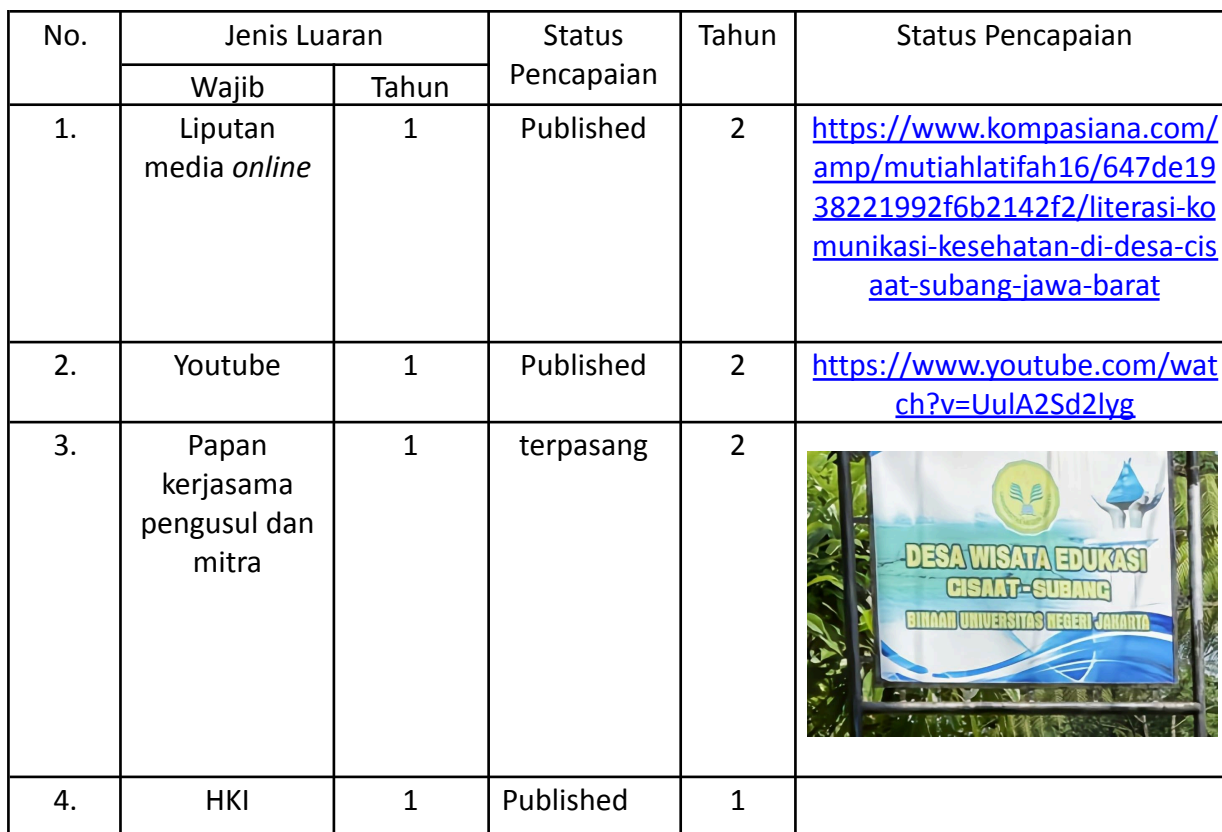
Luaran dan Target Capaian