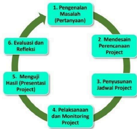
Gambar 4. Langkah-langkah pembelajaran berbasis proyek