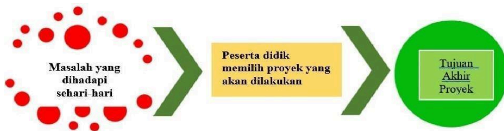
Gambar 3. Karakteristik Pembelajaran Berbasis Proyek

Dalam membuat rancangan pembelajaran berbasis proyekter dapat langkah-langkah yang harus disusun secara bertahap mulai dari mengidentifikasi masalah dengan pertanyaan pemicu yang diambil dari permasalahan kontekstual implementasi Profil Pelajar Pancasila kemudian merancang proyek secara kolaboratif antara guru dan peserta didik disertai program penjadwalan yang disepakati, setelah itu dilanjut ke tahap pelaksanaan. Di bagian akhir ada presentasi hasil yang akan dievaluasi dan kemudian menjadi refleksi untukperbaikan.