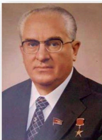
Юрий Владимирович Андропов (1982 – 1984)