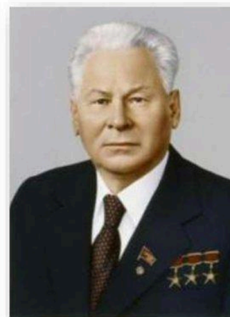
Константин Устинович Черненко (1984 – 1985)