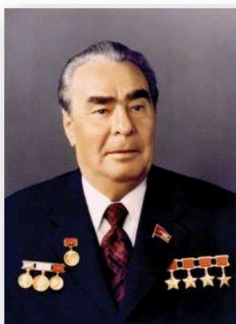
Леонид Ильич Брежнев (1964 – 1982)