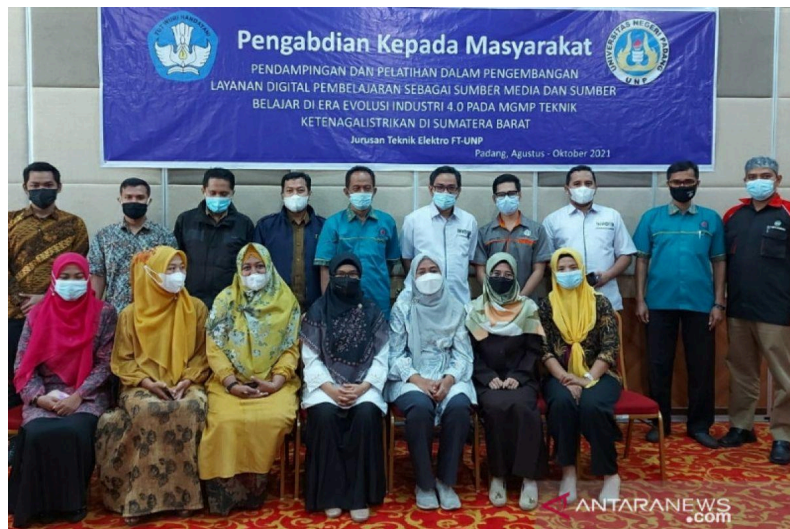
Gambar 1. Forum Diskusi Grup ( gambar harus kualitas Full HD )