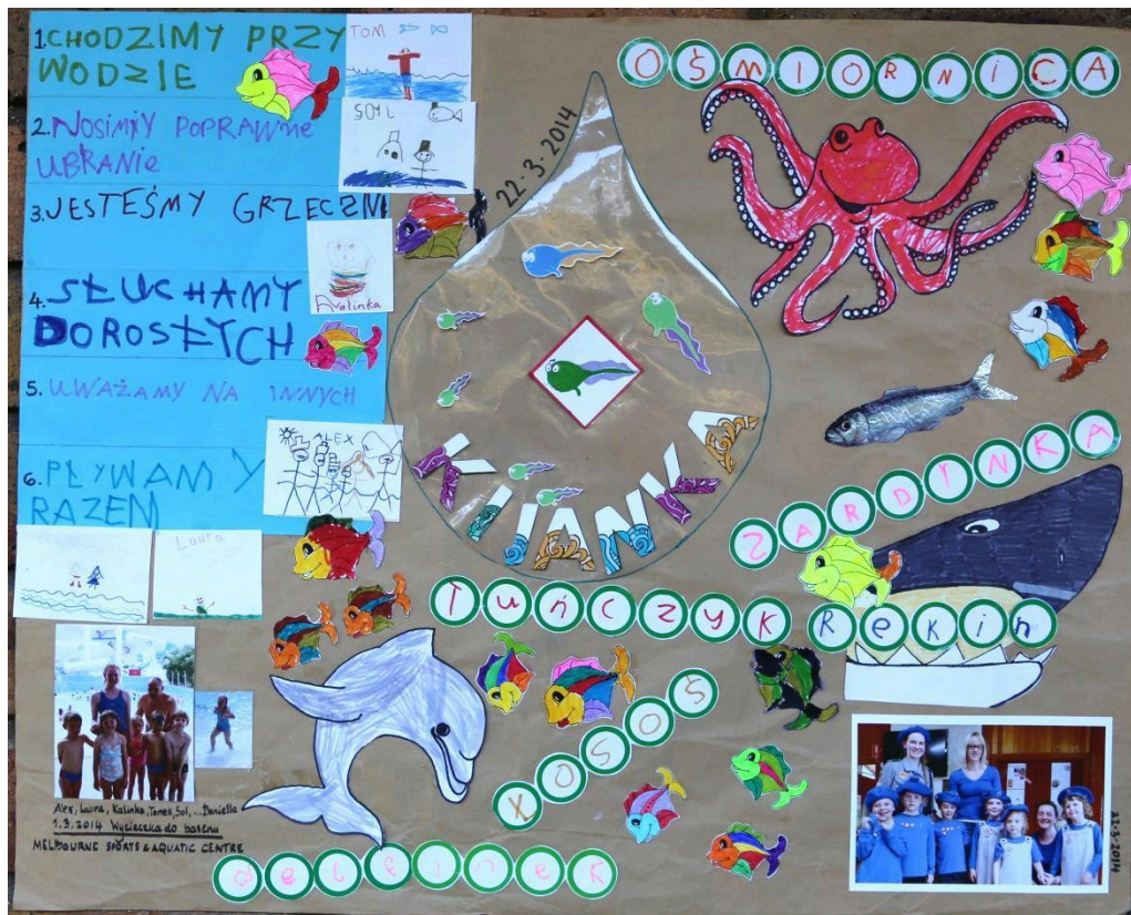
Plakat guziczka „Kijanka” (wykonana gromadka „Skrzaty Podhala”, South Melbourne, Victoria, Australia), 22.3.14

Pływające stworzenia były wybrane według obecnych [2014] poziomów na lekcjach pływania dla dzieci w skrzatowym wieku.