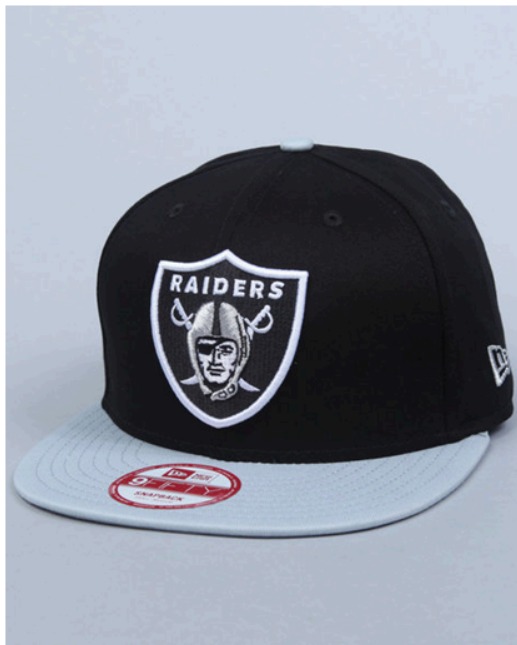
Кепка из магазина.

К.: Да, это просто магазин, где выставлены товары с сумасшедшей накруткой, и люди, которые их покупают, они их получают с ценником, по которому был приобретён этот товар где-нибудь в Америке. И человек видит, сколько он задонейтил. Купил кепку, и две цены кепки задонейтил на герилью. То есть, стараемся никого не обманывать, и сразу преподносим как есть. Это был один из источников, который был вынужден поддерживать проект, пока мы им занимаемся, а не занимаемся рекламными кампаниями, концепциями для брендов, потому что это бы тоже отвлекало.