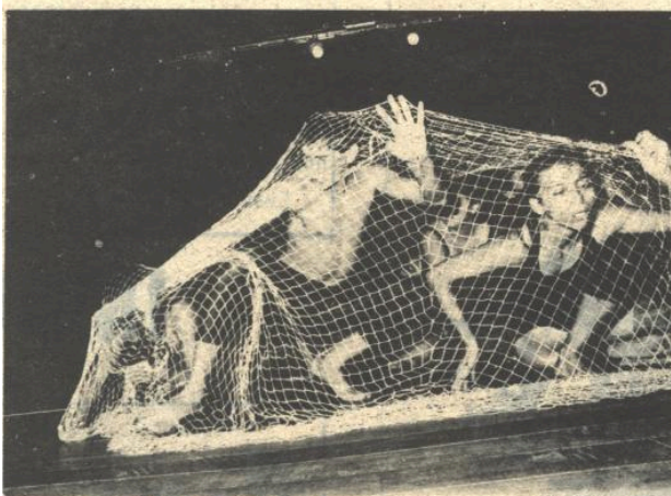
A dança dos animais amazônicos, bom espetáculo no Teatro Carlos Gomes.

O grupo de dança Fibras Tensas volta a apresentar o espetáculo Zoodança no Teatro Carlos Gomes, sábado, às nove da noite.