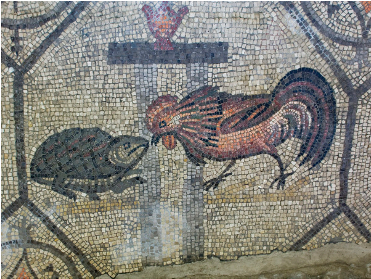
Mosaico della contesa tra il gallo e la tartaruga presso la Cripta degli Scavi ad Aquileia.

La raffigurazione forse più nota del mosaico teodoriano dell'aula nord è la contesa tra il gallo e la tartaruga. Il volatile, dal piumaggio arruffato, sta per attaccare la tartaruga, pavidamente rintanata nel suo guscio: tra i due animali, una colonnina regge un bel recipiente, il premio della lotta, secondo la consuetudine antica. Il significato è in questo caso trasparente: il gallo, annunciatore della luce, è allegoria di Cristo; la tartaruga, "abitatrice del Tartaro", cioè degli Inferi, è simbolo delle potenze tenebrose del male.