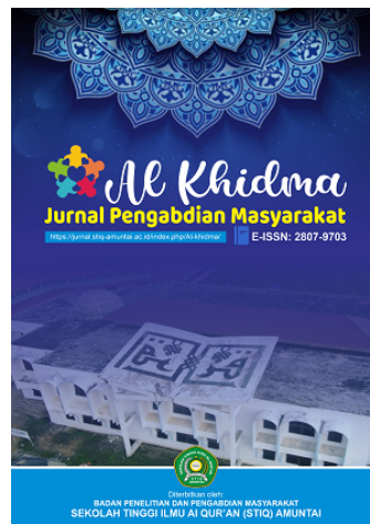
Gambar 1. Cover Jurnal Al Khidma