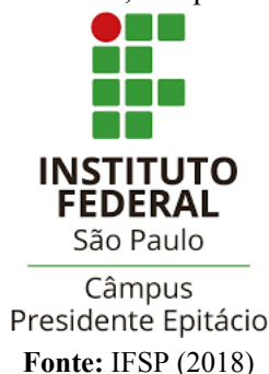
Figura 01 – Logo do IFSP, campus Presidente Epitácio

Comece aqui o parágrafo após a tabela, quadro ou figura. Continue escrevendo o texto. Nunca termine uma seção com ilustrações ou tabelas. Procure continuar com o texto de forma a estabelecer uma ligação com o item/seção seguinte.