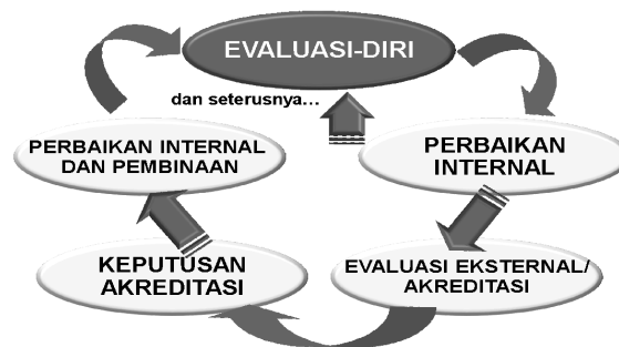
Gambar 1. Daur Penjaminan Mutu dalam Rangka Akreditasi

Seperti dikemukakan terdahulu, evaluasi diri merupakan salah satu aspek penting dalam keseluruhan daur akreditasi dengan berbagai peran dan kegunaannya, termasuk penjaminan mutu ( quality assurance ). Keseluruhan daur penjaminan mutu dalam rangka akreditasi program studi itu digambarkan dalam Gambar 1.