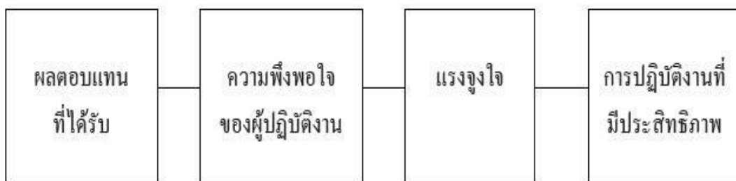
แผนภาพ 2 ความพึงพอใจนำไปสู่ผลการปฏิบัติงานที่มีประสิทธิภาพ