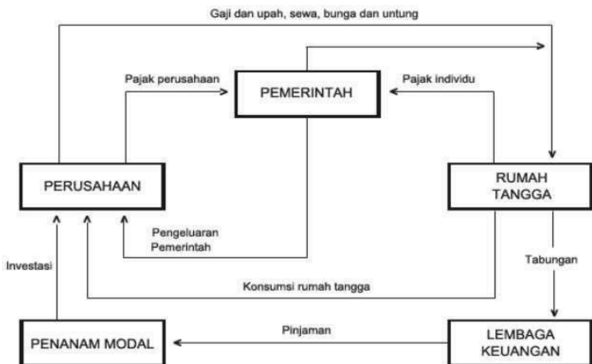
Gambar 5.1 Sirkulasi Aliran Pendapatan Perekonomian Tiga Sektor

c) Aliran yang ketiga adalah aliran pendapatan dari sektor pemerintah ke sektor rumah tangga. Aliran ini timbul sebagai akibat dari pembayaran keatas konsumsi faktor-faktor produksi yang dimiliki sektor rumah tangga oleh pemerintah.