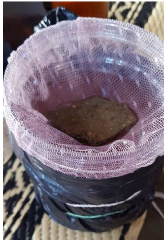
Gambar 1. Ecovitrak dalam rumah