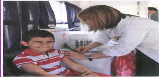
► Campaña de vacunación en el lanzamiento de la iniciativa de la Organización Mundial de la Salud "Semana de Vacunación en las Américas" en la ciudad de Montevideo, Uruguay, el 26 de abril de 2014.

Por un lado, este debe procurar que cada individuo, y sobre todo los grupos que son más vulnerables, tengan la posibilidad de acceder a servicios de salud de calidad, no solo para salvar la vida en una urgencia, sino también para aliviar el sufrimiento o restablecer el máximo nivel de salud que se pueda lograr. Por otro, tiene que garantizar cierto grado de salud pública. Esto implica que debe llevar adelante medidas para lograr la total inmunización contra las principales enfermedades infecciosas, así como mantener buenas condiciones ambientales. También tiene que ofrecer servicios de procesamiento y distribución de agua potable, control de plagas y gestión de residuos, entre otros.