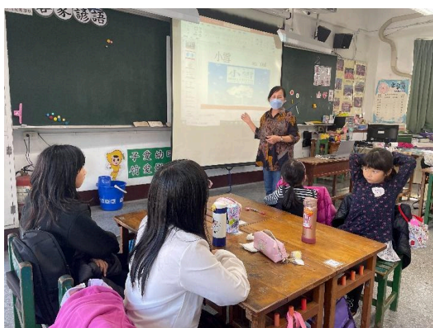
二十四節氣中的第20個節氣—小雪