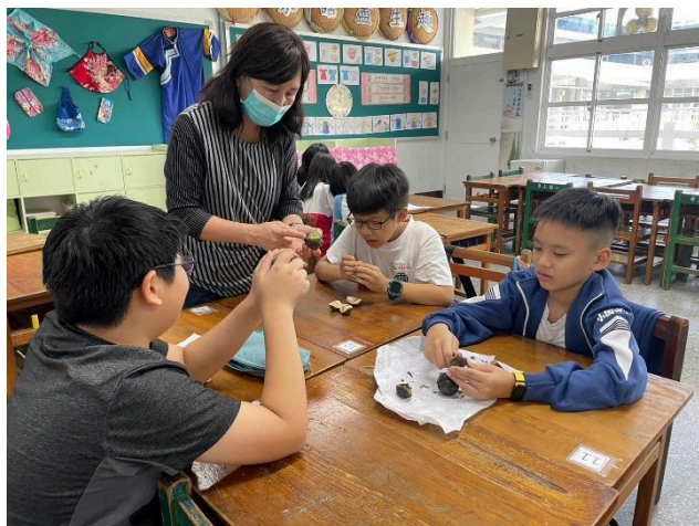
原來油桐子是這麼的堅硬