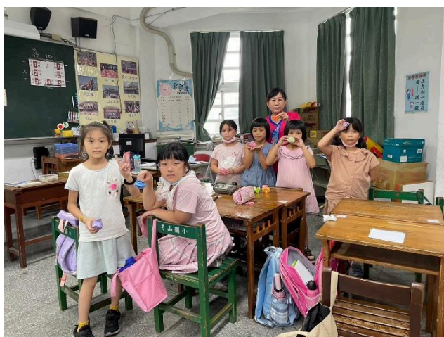
完成折紙作品—兔子