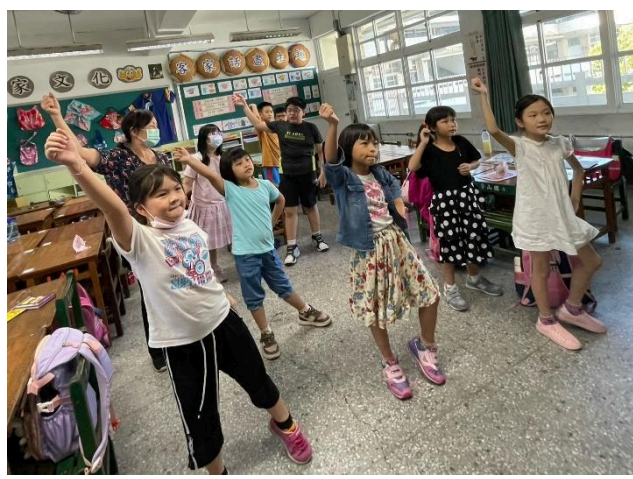
客家童謠—加油加油