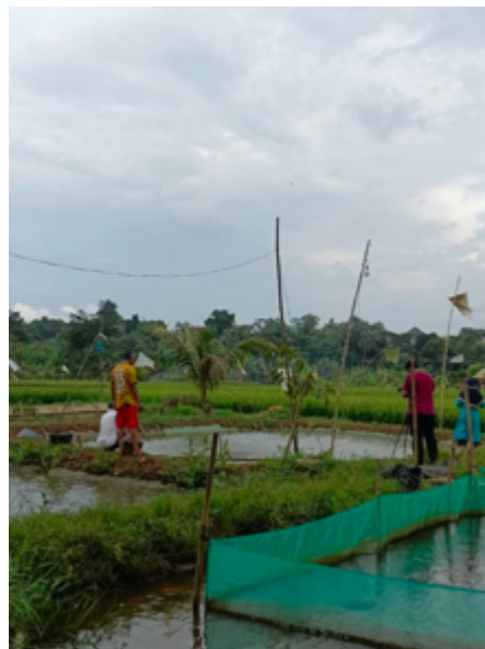
Gambar 1. Xxxx

Jurnal versi cetak dicetak dengan warna hitam putih, penulis sebaiknya menyesuaikan gambar dengan kondisi tersebut. Contoh peletakan serta penamaan gambar seperti pada Gambar 1, Gambar 2, dan contoh menampilkan diagram pada Gambar 3.