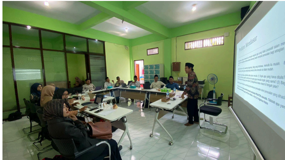
Gambar 1. Dokumentasi Penelitian