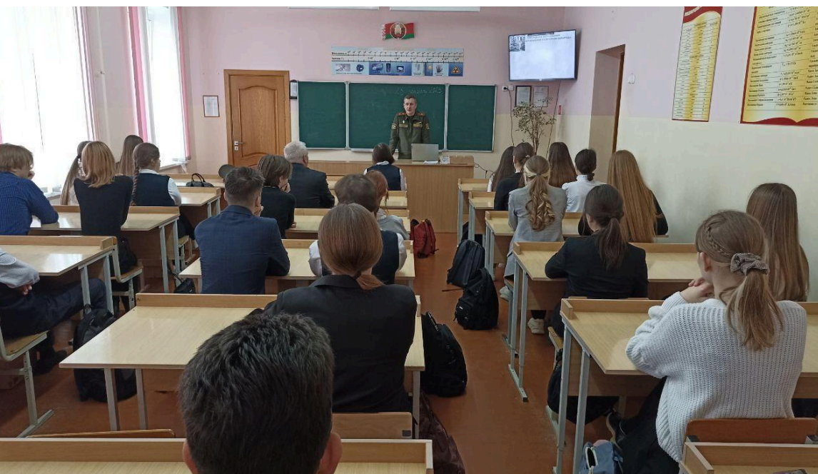
Профориентационная встреча с курсантами Белорусской государственной академии авиации