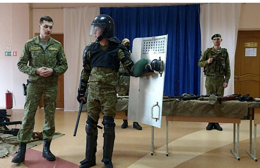
Профориентационная встреча с представителями Сморгонской пограничной группы