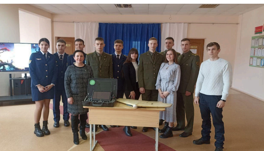
пограничной группы в/ч 2044