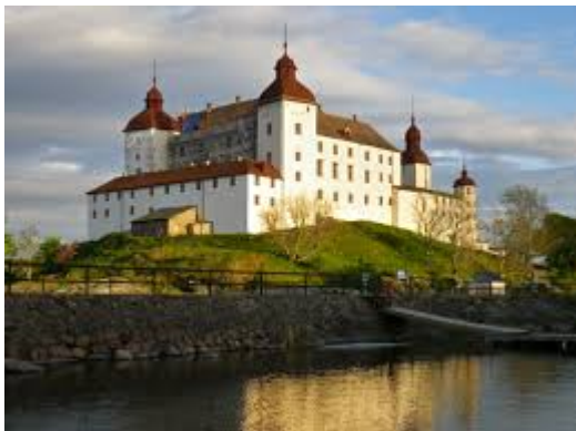
ett slott många slott