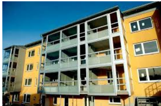
en lägenhet många lägenheter ett fyrvåningshus