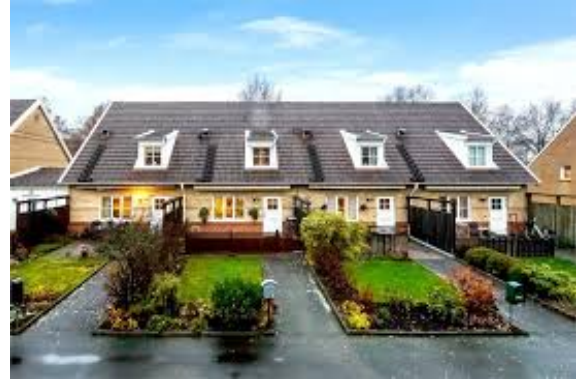
ett radhus många radhus