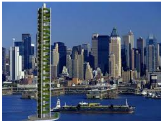
en skyskrapa många skyskrapor