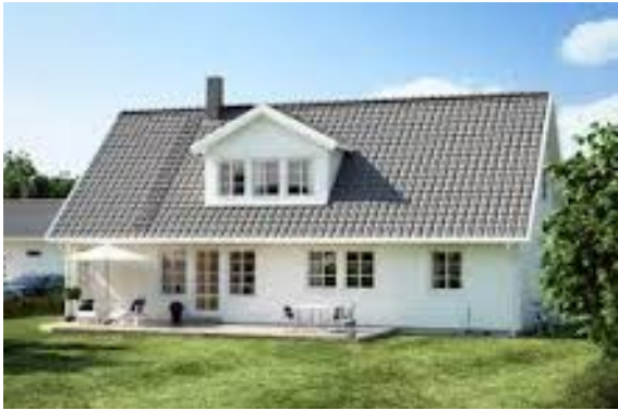
en villa många villor