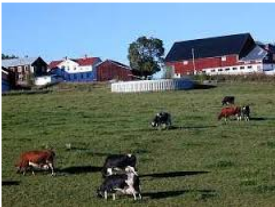
en bondgård många bondgårdar