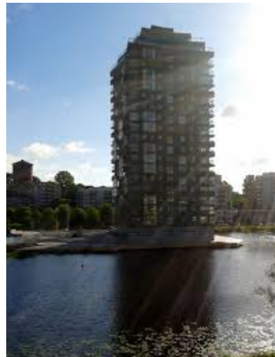
ett höghus många höghus