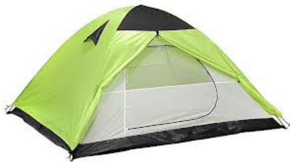
ett tält många tält