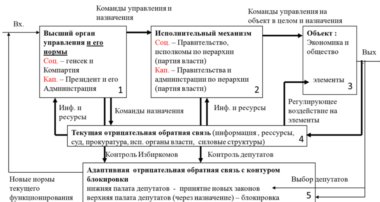
Рис. 1. Кибернетическая система государственной власти

Кибернетика предполагает, что в системе всегда присутствует высший орган управления, который является носителем идеи и соответственно норм (правил работы) всей системы управления (блок 1, рис. 1). Исходя из своего представления об идеальном функционировании всей системы (вход, рис.1), высший орган управления передаёт команды управления на всю систему, как объект управления.