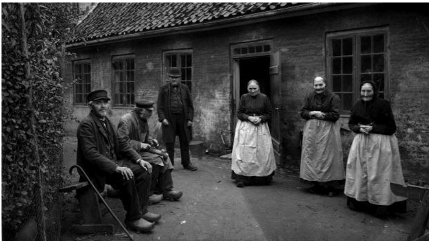
Foto fra fattiggård i Roskilde omkring år 1900

Det moderne gennembruds forfattere beskrev livet i de nye bysamfund med deres menneskemylder og trange boligkvarterer. Men de skrev også om det ofte fattige og fysisk udmarvende liv på landet.