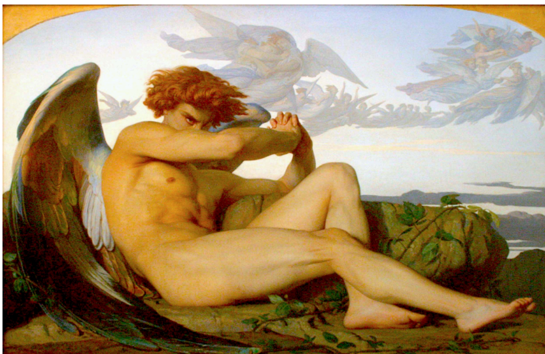
Imagem 1. Pintura "El ángel caído", de Alexandre Cabanel, 1847

Imagens, fotografias, gráficos e tabelas devem ser evitados, sendo inseridos somente quando sua utilização é primordial para o entendimento do trabalho científico. Quando inseridos sempre devem possuir numeração, título e fonte. A fonte deve ser inserida mesmo que a imagem, fotografia, gráfico ou tabelas tenham sido desenvolvidas por você. A numeração e o título devem constar sobre a imagem com fonte tamanho 10, espaçamento simples e em negrito. A fonte deve ser inserida logo abaixo, também com fonte tamanho 10, espaçamento simples e sem negrito (A palavra "Fonte:" fica em negrito, mas não a fonte em si. Ambos devem ser centralizados. Exemplo: