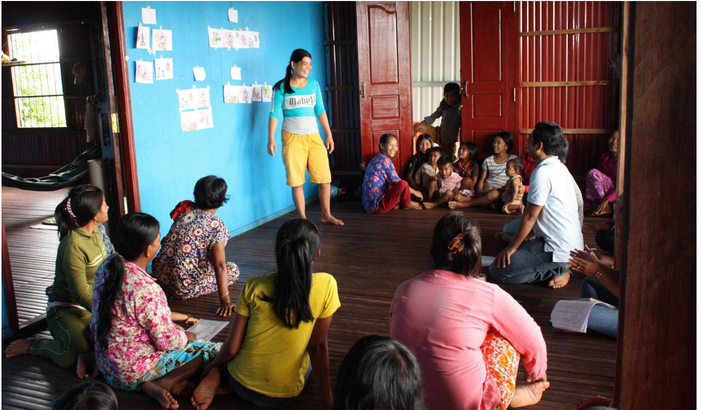
រូបភាព ៤ សិក្ខាកាមដែលចូលរួមក្នុងវគ្គសិក្ខាសាលាស្តីពីអនាម័យ និងការរស់នៅស្អាត ធ្វើឡើងពីថ្ងៃទី ២៣ ដល់ ២៥ ខែតុលាឆ្នាំ ២០១៧