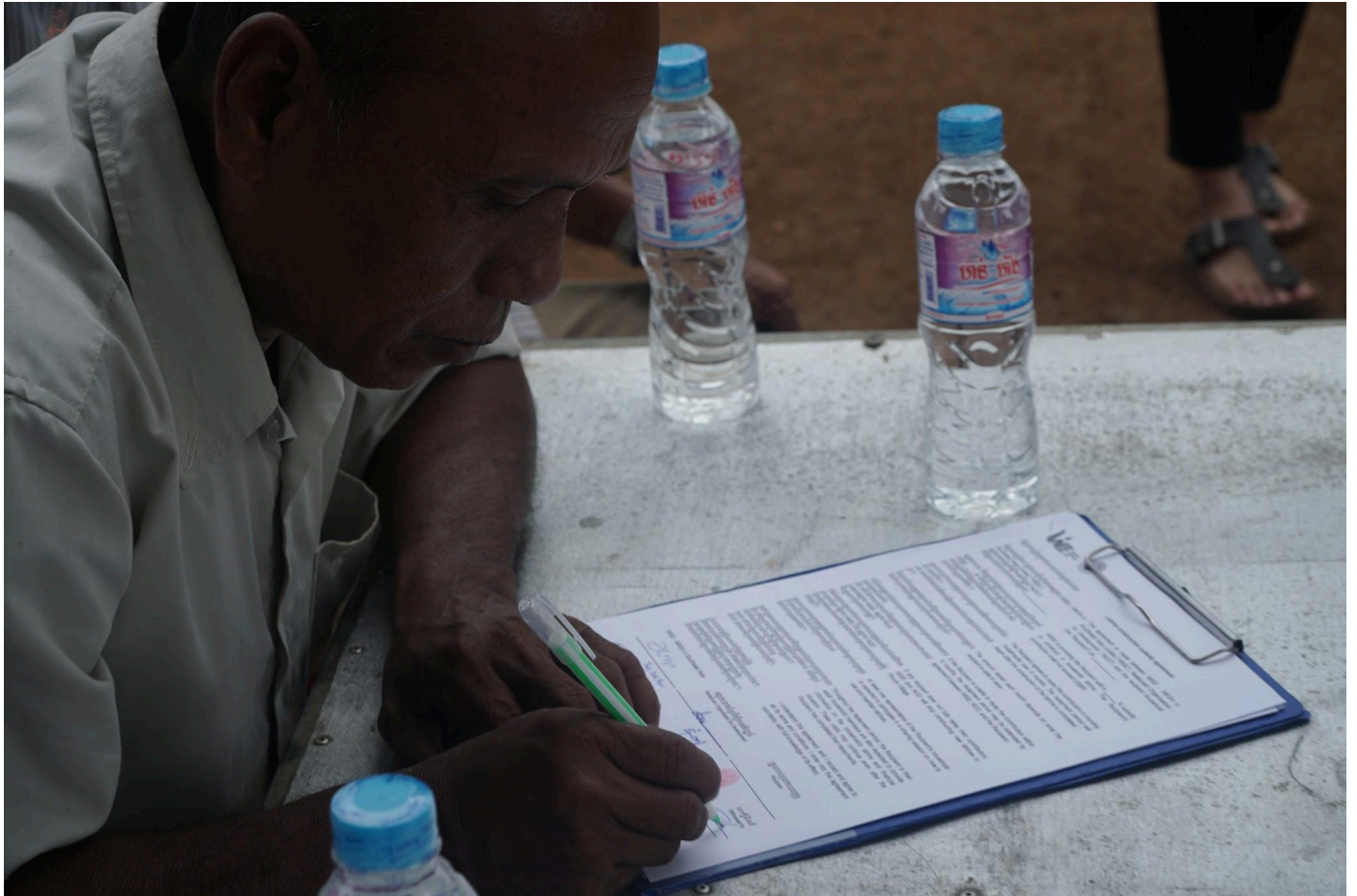
រូបភាព ១៤ ប្រធានភូមិធ្វើជាសាក្សីចំពោះកិច្ចព្រមព្រៀងចុះហត្ថលេខាដោយតំណាងគ្រួសារដែលទទួលបានបង្គន់ តំណាង WISE និង NOD

ជំហាន មិនមានគម្រោងថា នឹងបង្កើតកម្មវិធីអ្វីជាផ្លូវការទាក់ទងនឹងកម្មវិធីឧបត្ថម្ភសាងសង់បង្គន់អនាម័យនេះទេ។ WISE ប៉ុន្តែដៃគូនិងសមាជិកក្នុងគ្រួសារនានាផ្តល់មតិយោបល់ថា បើមានកម្មវិធីអ្វីជាផ្លូវការមួយនោះគម្រោងយើងនឹងមានភាពស្របច្បាប់បន្តិច។ ហេតុនេះ យើងក៏បានបង្កើតជាកម្មវិធីតូចមួយនាព្រឹកថ្ងៃទី 08 ខែកក្កដា 2018 ដោយមានការចូលរួមពីតំណាងគ្រួសារដែលទទួលបានបង្គន់ និងប្រធានភូមិ និងអនុប្រធានភូមិ ដែលនឹងត្រូវចុះកិច្ចសន្យាព្រមព្រៀងនឹងគម្រោង (រូបភាព 14)។