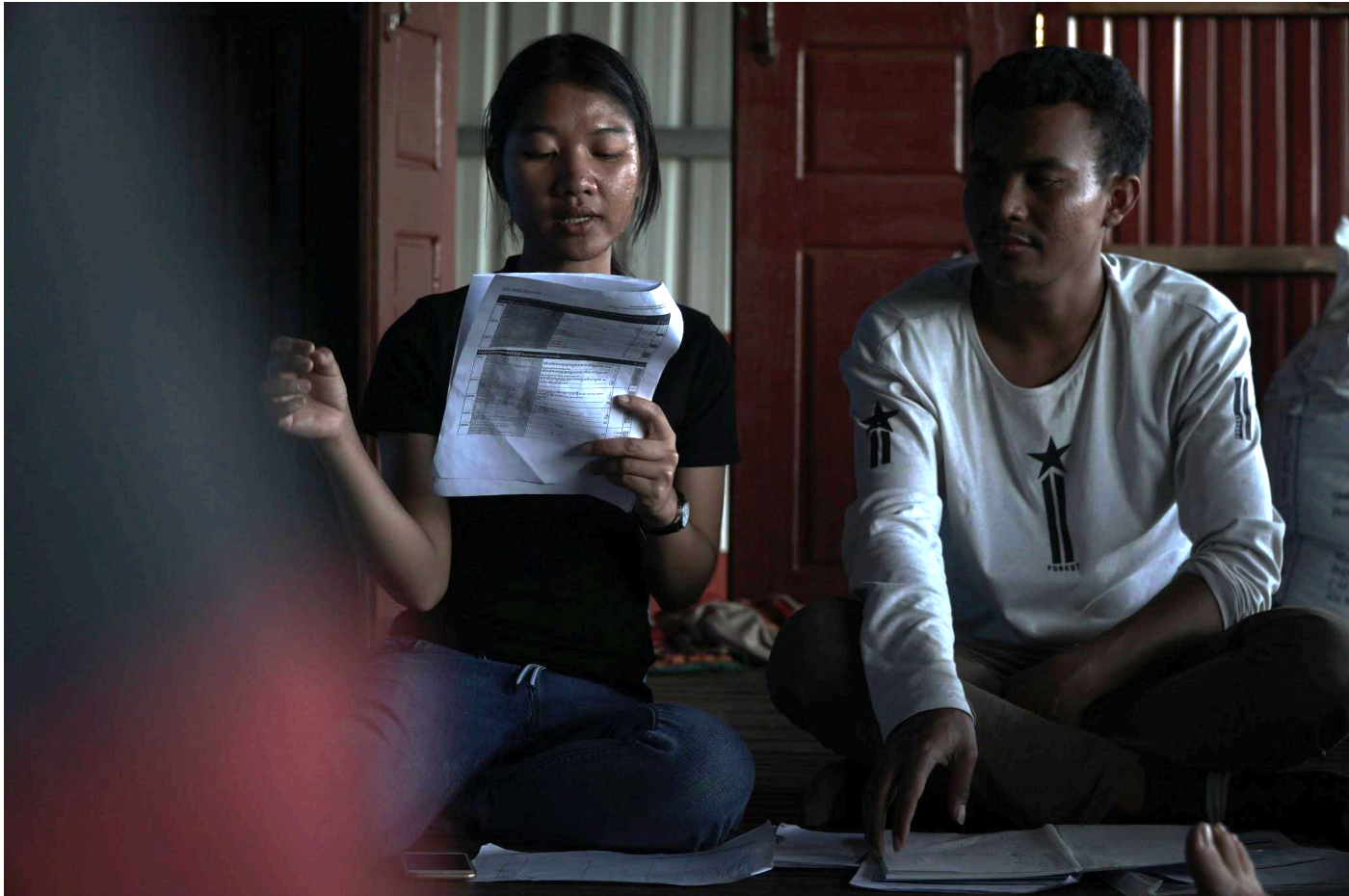
រូបភាព ១១ ផ្តល់អនុសាសន៍ចំពោះបេក្ខជនដែលត្រូវដកបេក្ខភាព (📷Andry Hamida)

ទោះជាបញ្ហាទាំងនេះធ្វើឱ្យមានពិភាក្សានិងមតិផ្សេងៗគ្នាក៏ដោយ ជាចុងក្រោយគណកម្មាធិការជ្រើសរើសបានទទួលបានការមូលមតិគ្នានៅលើករណីភាគច្រើន។