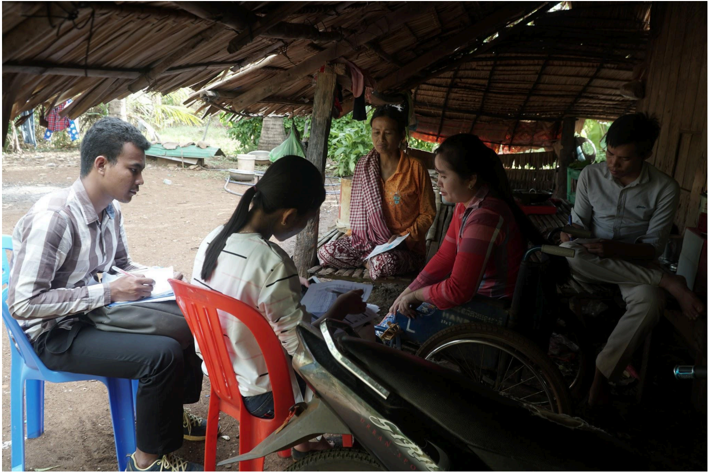
រូបភាព ៩ ការសម្ភាសបេក្ខជន

២០%ការរួមចំណែកទៅឋានសំណង់ការចំណាយប្រសិនបើពួកគេត្រូវបានជ្រើសរើស ហើយថាក្បាល/ប្រាជ្ញានឹងមិនសាងសង់ណាមួយទៀតឬប្រសិនបើពួកគេមិនបានបញ្ចប់ការសបសពពួកគេរួមចំណែក។