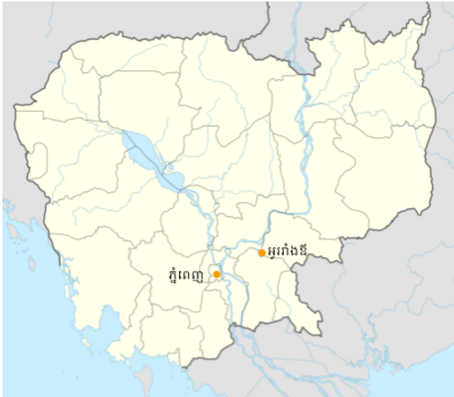
រូបភាព ១ ទីតាំងនៃអូររាំងឌីស្រុក(ប្រែប្រួលពីផែនទី Google)

ទីតាំងស្ថិតក្នុងឃុំព្រះធាតុ (ស្រុកអូររាំងឌី ខេត្តត្បូងឃ្មុំ ប្រទេសកម្ពុជា) ( រូបទី ១ ), ភូមិភ្នំមាន ១០១ គ្រួសារ ១ ត្រូវជា ៥២១នាក់ ២ ។