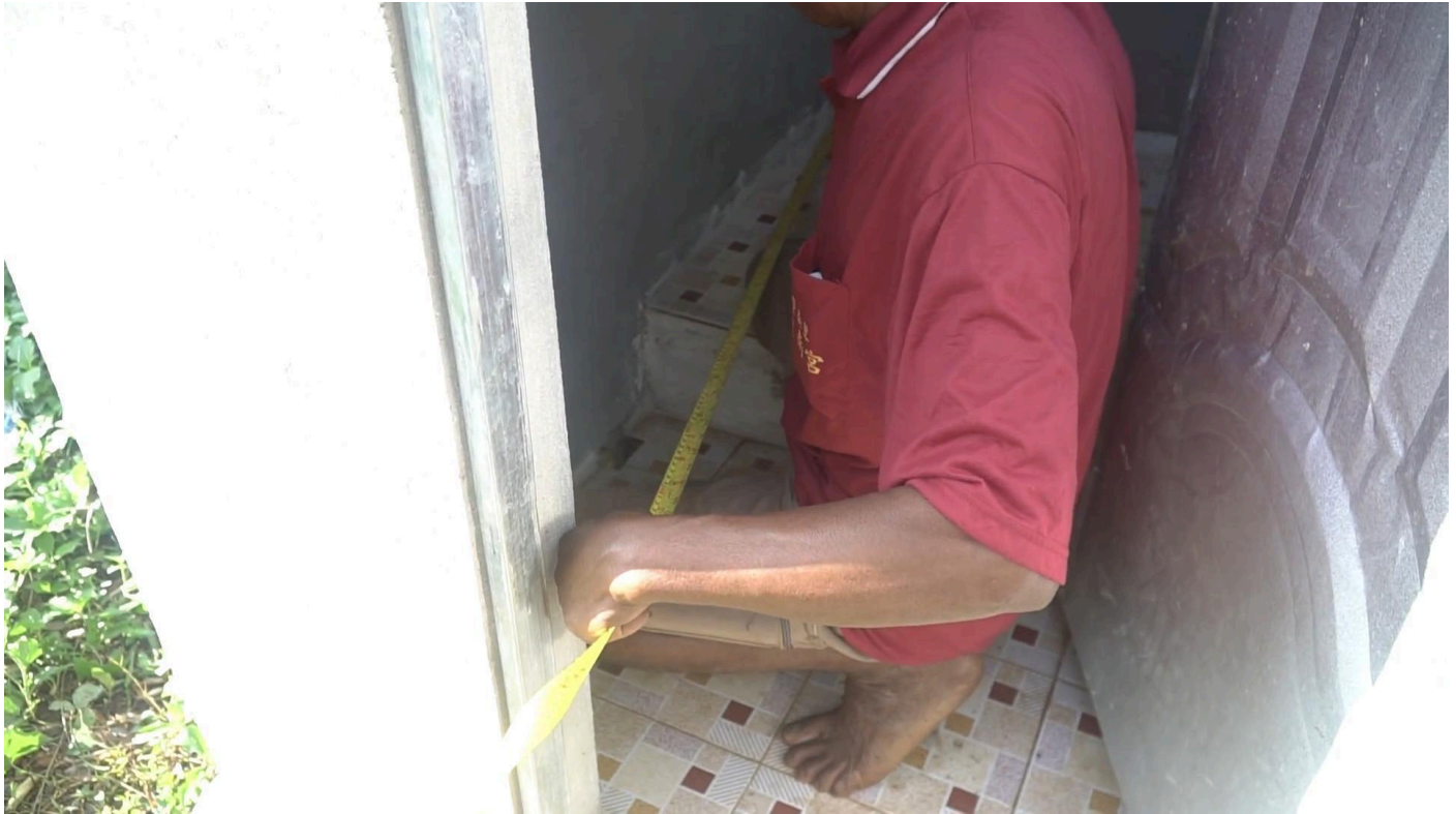
Figure 15 Measuring the length of the public latrine in Phnom Village