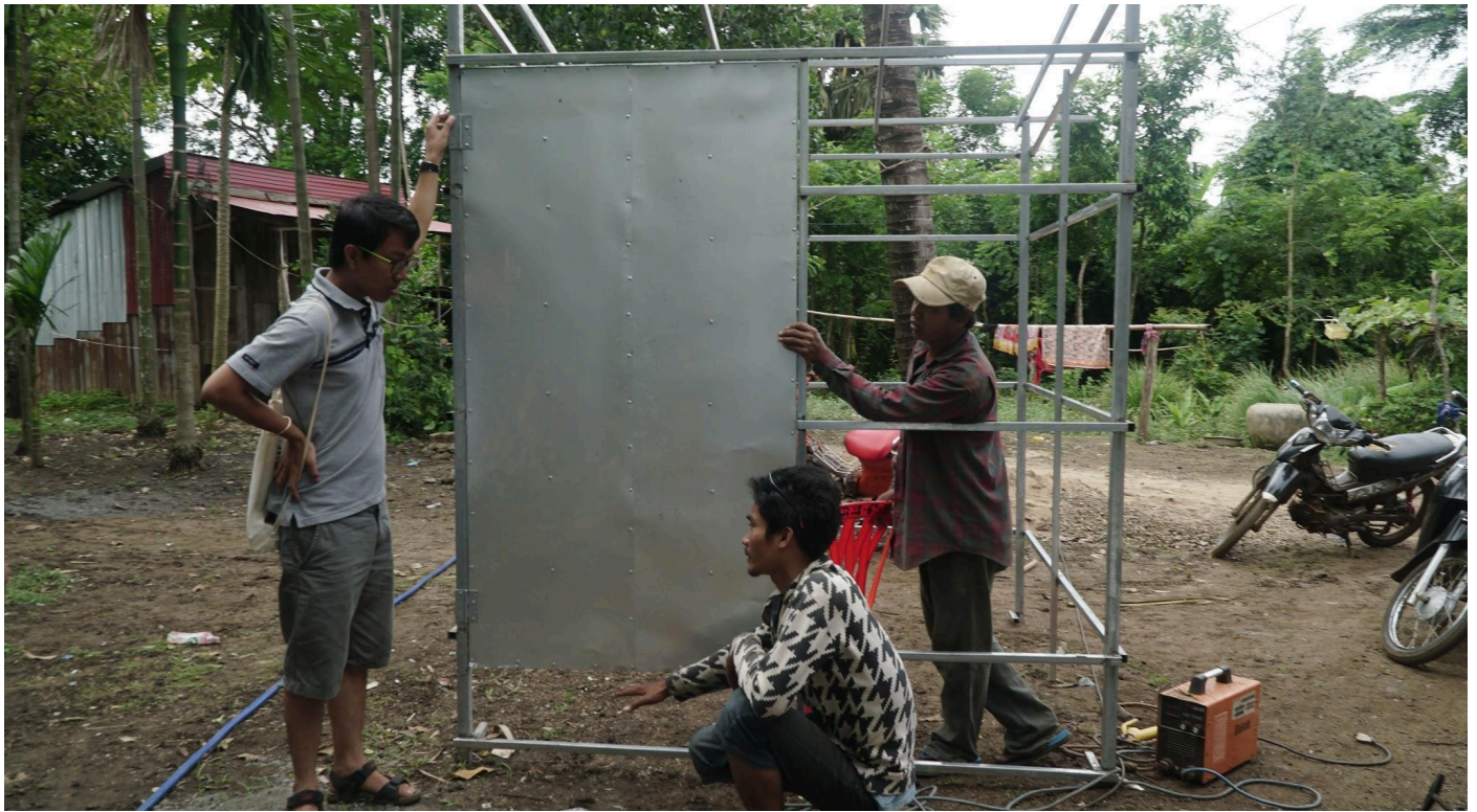
Figure 18 For example, the door had been installed on the wrong side of the latrine