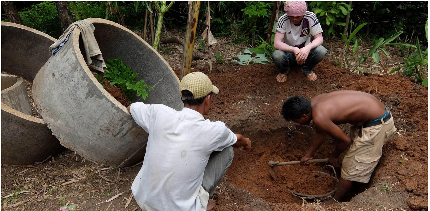
Figure 17 A worker digging a latrine pit