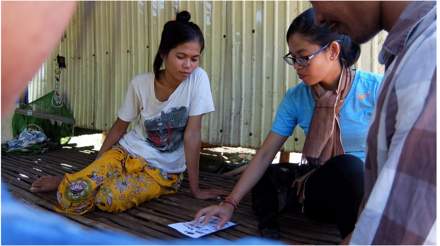
រូបភាព ៧ ចែករំលែកព័ត៌មានពីកម្មវិធីឧបត្ថម្ភសាងសង់បង្គន់

ដើម្បីបញ្ចប់ការផ្សព្វផ្សាយគម្រោងកាន់តែរហ័យ ក្រុមការងារអនុវត្តគម្រោងសម្រេចចិត្តចុះតាមគ្រួសារណា ដែលក្រុមយើងសង្កេតឃើញថា ក្រីក្រ ដោយផ្អែកលើទំហំនិងគុណភាពផ្ទះ ដែលមិនមានបង្គន់។ តែអ្វីដែលជាបញ្ហាប្រឈមនោះគឺថា ក្រុមការងារយើងអាចវិនិច្ឆ័យខុសលើស្ថានភាពគ្រួសារក្រីក្រ។ បញ្ហាជាក់ស្តែងកើតមានបន្ទាប់ពីអ្នកភូមិម្នាក់មកជួបផ្តល់ជាមួយក្រុមការងារអនុវត្តគម្រោងយើង ដើម្បីមកដាក់ពាក់ស្តុកគម្រោងឧបត្ថម្ភធ្វើបង្គន់ ។ គាត់គិតថាបង្គន់អនាម័យនឹងសាងសង់ក្នុងទម្រង់សន្លឹកស័ង្កសី ដែលអាចឲ្យសមាជិកគ្រួសារគាត់រៀនទឹកខាងក្នុងនោះបាន។