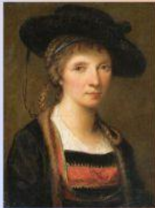
автопортрет, 1781 р.

Однією з перших відомих жінок-художниць була представниця німецького класицизму Ангеліка Кауфман (Ангеліка Марія Ганна Катарина Кауфман). У творах художниці багато емоцій, штучності у поведінці; прагнення до античної простоти і гармонії поєднувалося зі своєрідним колоритом і різноманітними кольоровими ефектами. Кауфман працювала з гравюрами, в галузі розробки меблів та інтер'єрів, створювала складні графічні візерунки для розпису посуду. Вона створила також серію портретів сучасників.