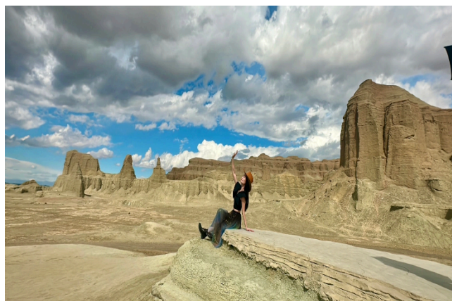
Thành phố quỷ trên Biển