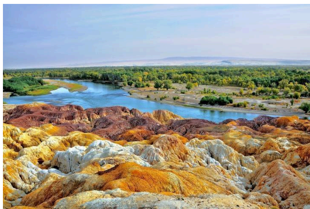
Bãi Ngũ Sắc

Sáng: Quý khách ăn sáng tại nhà hàng sau đó xe đưa quý khách di chuyển tham quan, băng qua tuyến đường cao tốc sa mạc S21. Trên đường đi, quý khách sẽ có cơ hội chiêm ngưỡng phong cảnh thiên nhiên tuyệt đẹp được tạo nên bởi sa mạc rộng lớn.