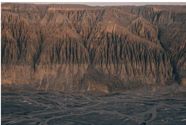
Hẻm núi lớn Dushanzi

BURQIN – HẸM NÚI DUSHANZI GRAND CANYON – KUITUN (ĂN SÁNG/ TRƯA/ TỐI)