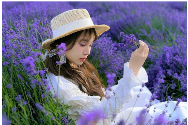
Trang viên hoa oải hương

Ăn sáng tại khách sạn. Sau bữa sáng, đoàn làm thủ tục trả phòng. Xe và HDV đưa đoàn khởi hành đi Yining . Trên đường đoàn ghé thăm: