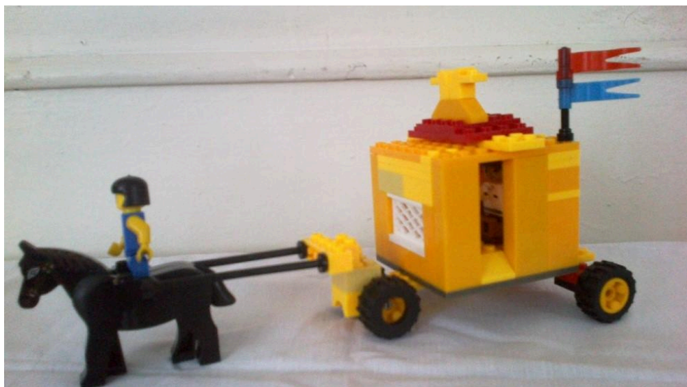
Карета с лошадью для короля.

Сложное соединение деталей при сборке рук, плеч, головы, пера на шляпе.