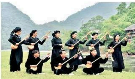
Thực hành Then