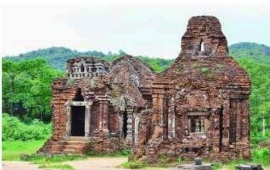
Thánh địa Mi Sơn