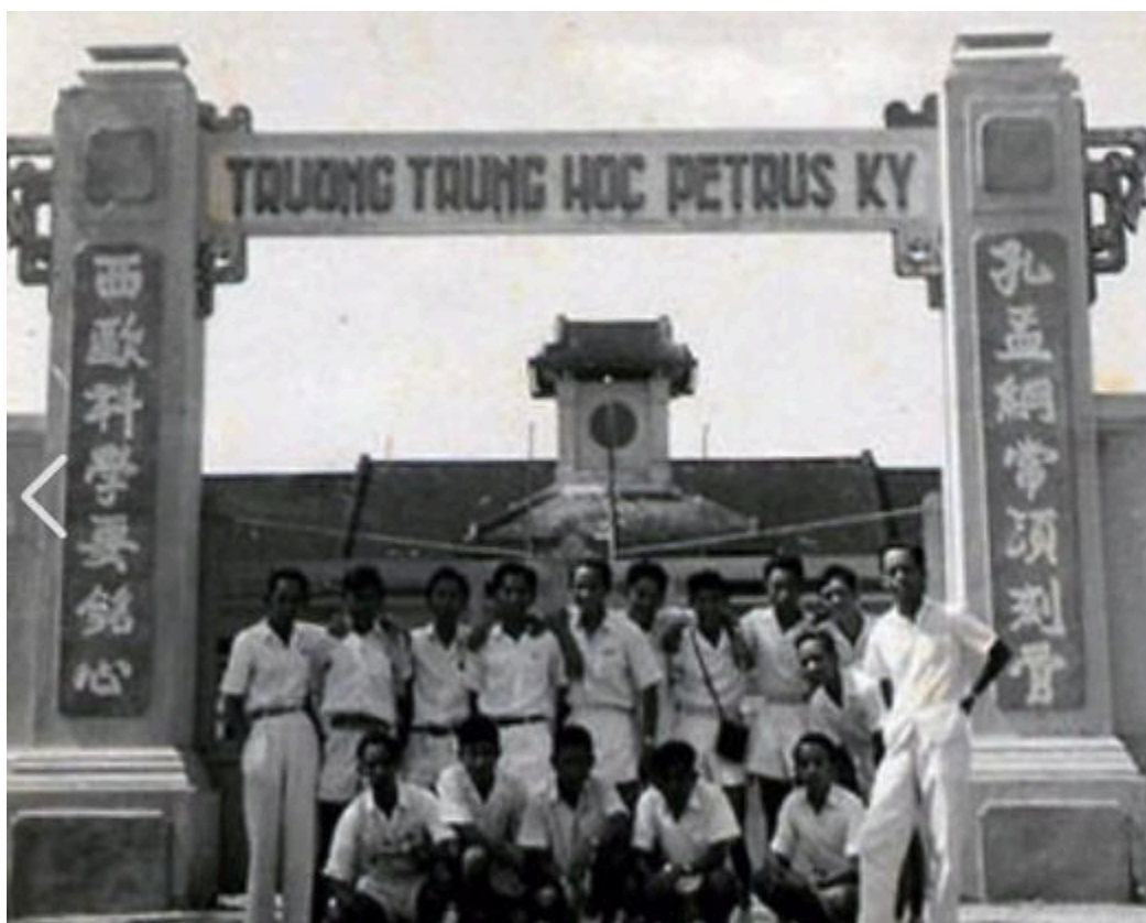
Cổng Trường Trung Học Petrus Ký Trước 1975