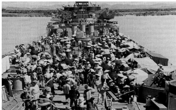
Vietnamese Refugees board U.S. Navy LST at Haiphong.