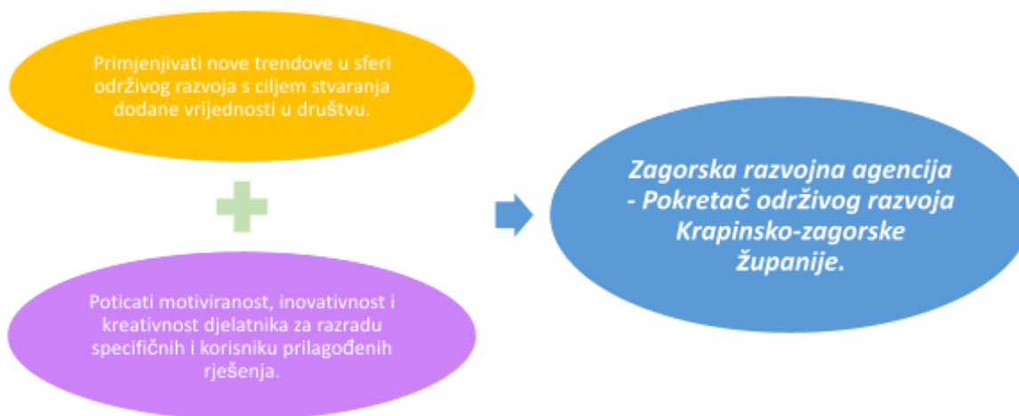
Grafikon 2 - Vizija i misija Zagorske razvojne agencije

Plan rada Zagorske razvojne agencije za 2020. godinu strukturiran je tako da pokazuje specifične aktivnosti koje će se provoditi unutar svakog od zadanih ciljeva poslovanja. Aktivnosti su prikazane opisno te su tablično prikazane konkretne akcije koje će se provoditi unutar svake od aktivnosti. Definirani su i indikatori za praćenje uspješnosti provedbe planiranih aktivnosti, a kako bi se na godišnjoj razini kvalitativno i kvantitativno ocijenio doprinos ostvarenju zadanih učinaka definiranih Strateškim planom razvoja zagorske razvojne agencije do 2020. godine.