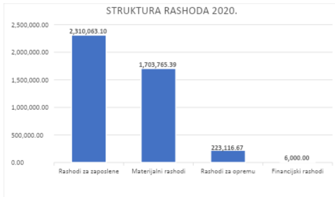
Grafikon 2: Struktura rashoda Zagorske razvojne agencije u 2020. godini

Iz predstavljenih podataka u grafikonima 1 i 2 je vidljivo da će poslovanje Agencije u 2020. godini biti obilježeno provedbom aktivnosti koje su planirane u okviru projekata sufinanciranih sredstvima EU.