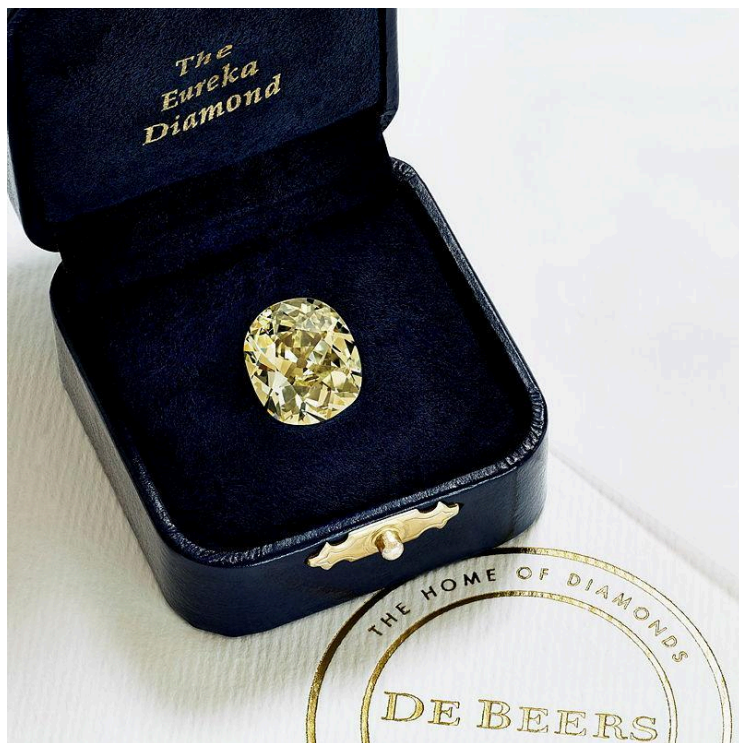
Alt Text: 「尤里卡鑽石」

到了13世紀，鑽石開始出現在歐洲皇室珠寶中 4 ，通常被鑲嵌在宗教聖物或華麗的加冕禮服上。隨著貿易路線的擴展，它們從印度傳入歐洲的宮廷，並迅速被視為稀有而珍貴的寶物。