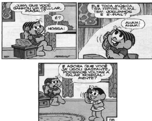
SOUZA, Maurício de. Mônica . Gibi, nº 10. Maurício de Sousa, p. 82, 2007.